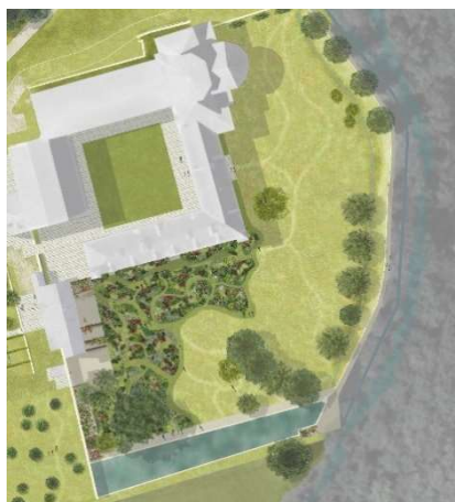
« Projet d'aménagement du parc paysager de l'abbaye de Beaulieu » 2029 © Patrice Bideguain paysagiste - Greenconcept