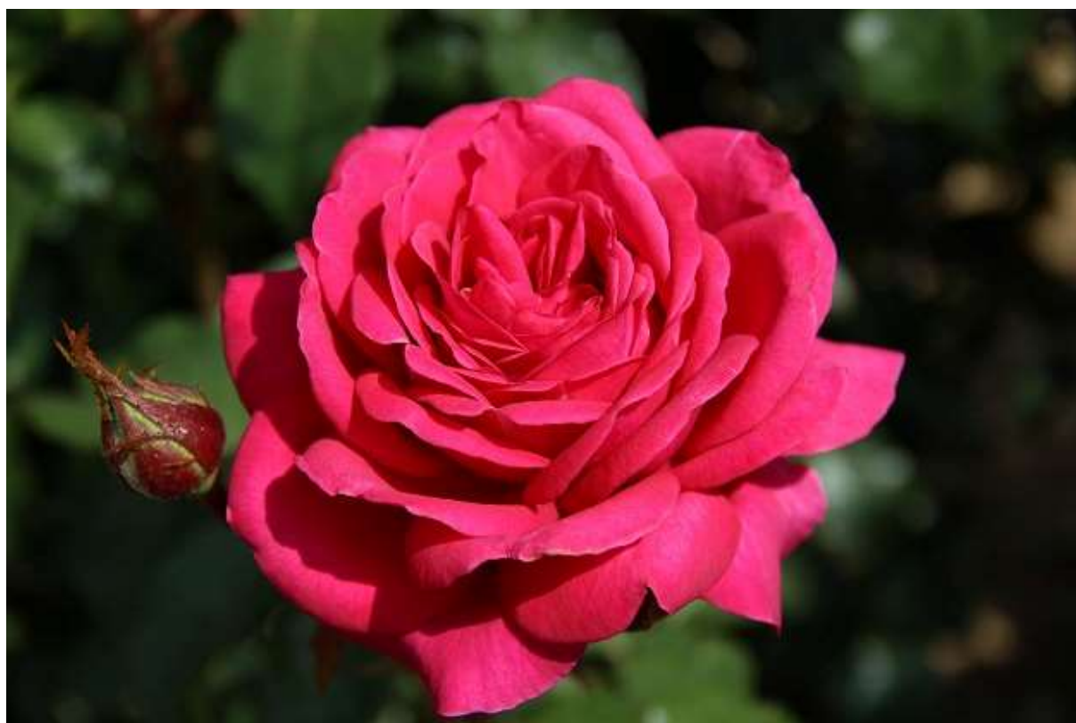
ABBAYE DE BEAULIEU Le rosier hommage à Geneviève Bonnefoi créé par Jérôme Rateau pour ANDRE EVE ®

dans le cadre de « Ma pierre à l'édifice », opération de mécénat participatif.