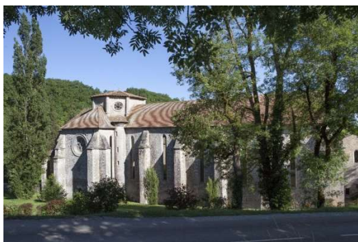
Abbaye de Beaulieu-en-Rouergue

L'abbaye de Beaulieu-en-Rouergue est fondée au XII e siècle, alors que l'ordre cistercien créé au siècle précédent connaît un essor considérable et que fleurissent de nombreuses abbayes « filles » de Cîteaux – lieux où les moines s'établissent dans la solitude.