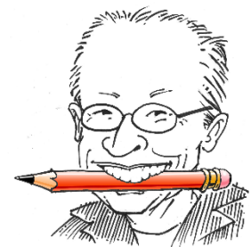
Croquis de et par Rosendo Li

Depuis septembre 2021, il « croque » régulièrement les répétitions et les moments « off » (de l'équipe technique, billetterie, des spectateurs...). Chaque mois, les croquis sont affichés dans le théâtre, les visiteurs pourront les (re)découvrir pendant le festival, sorte de clin d'œil dessiné à d'autres disciplines culturelles dans notre cité.