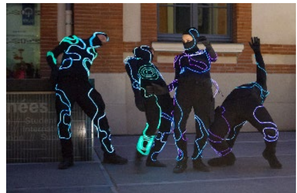
Photo spectacle Les Lumenes

Un spectacle déambulatoire et visuel, les Lumenes, initiera des chorégraphies dessinées pour clôturer cette première édition.