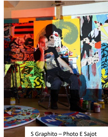
S Graphito

Speedy Graphito, l'un des pionniers du mouvement "Street'Art " français (art contemporain urbain), s'associe au festival en par son parrainage, sorte de prélude à son installation et à l'exposition programmée cet été 2022 au MIB. L'artiste sera présent toute la semaine du 16 au 22 mai pour aller à la rencontre des artistes invités du festival.