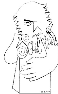
Croquis de Bourdelle par DEVO

DEVO sera présent le jeudi 19 mai de 17 h à 19h pour échanger avec le public.