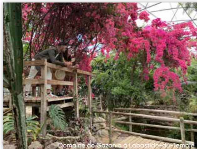
Domaine de Gazania à Labastide-du-Temple