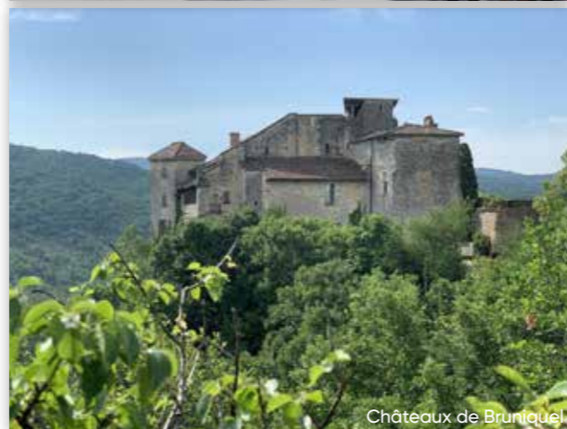
Châteaux de Bruniquel