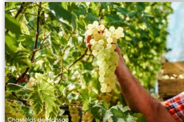
Chasselas de Moissac