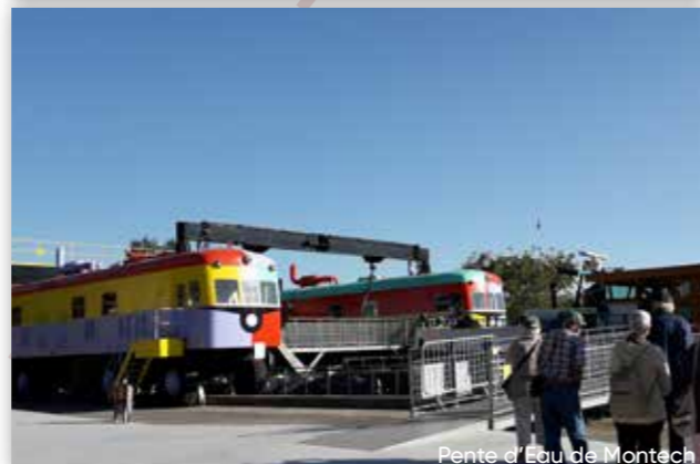
Pente d'Eau de Montech