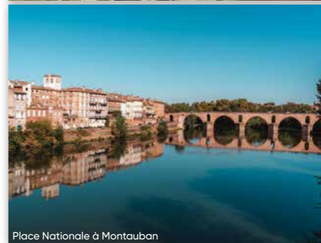
Place Nationale à Montauban

En fin d'après-midi, découvrez une ferme chasselière sur les coteaux de Moissac et dégustez un produit d'exception : le Chasselas de Moissac .